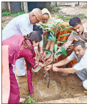
रेवाड़ी। स्वर्ग आश्रम में पौधा लगाते हुए।