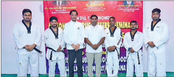
रेवाड़ी। सेमिनार में मौजूद जिले के कोच व खिलाड़ी।