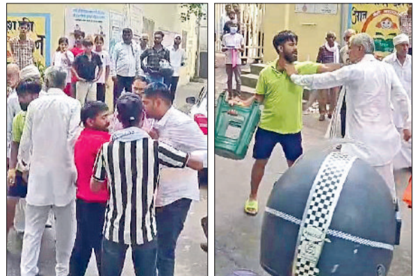
रेवाड़ी। पार्किंग के पैसे को इग्नोर हुए कर्मचारी व कार चालक व पार्किंग शुल्क को लेकर एक दूसरे की गिरेबान पकड़े हुए।