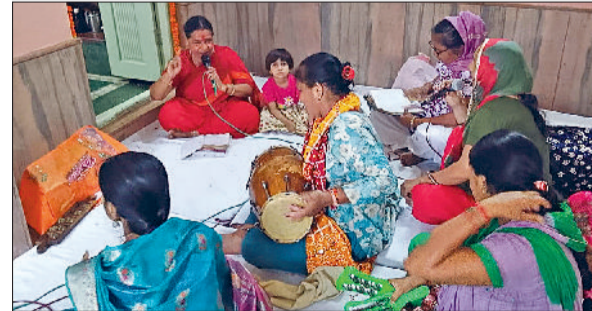
रेवाड़ी। माता के मंदिर में कीर्तन करते हुए श्रद्धालु।