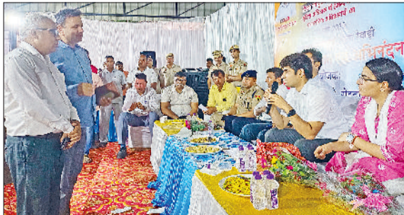
रेवाड़ी। कार्यक्रम में लोगों की समस्याएं सुनते डीसी व अन्य अधिकारी।