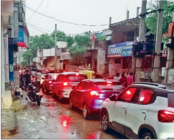
रेवाड़ी। धारुहेड़ा की फिरनी में सोमवार शाम को लगा जाम। व फिरनी में जाम से लगी वाहनों की कतार।

धारुहेड़ा की फिरनी में अवैध रूप से हो रही वाहनों की पार्किंग से रोजाना आवागमन बाधित रहता है, जिससे नागरिकों को निकलने में परेशानी उठानी पड़ रही है। लोगों ने एसपी से सड़क पर गाड़ी खड़े करने वाले वाहन चालकों का चालान करने व वाहनों को जब्त करके समस्या का समाधान कराने की मांग की है। सोमवार शाम को फिरनी में अवैध पार्किंग वजह से वाहनों का लंबा जाम लग गया। वाहन चालकों को जाम से निकलने के लिए घंटों तक इंतजार करना पड़ा। धारुहेड़ा की फिरनी की पर अवैध रूप से बनी झील मार्केट व बक्शी मार्केट के वाहन के अलावा काफी संख्या में ऑटो खड़े रहते हैं। फिरनी से क्षेत्र के पांच गांवों के लोगों के