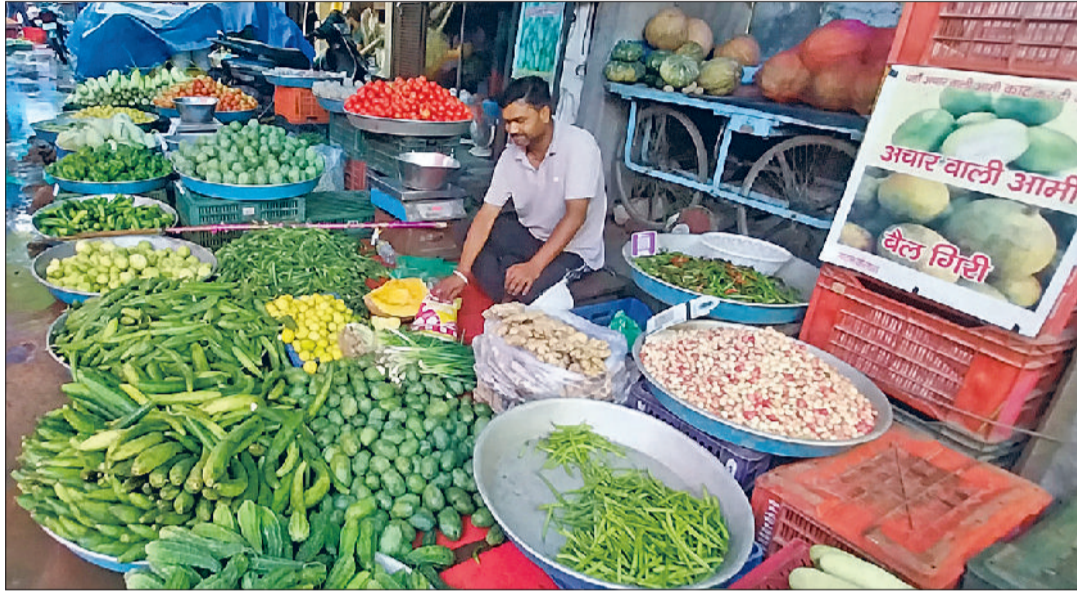
रेवाड़ी। नाईवाली सब्जीमंडी में दुकान पर लगी हुई सब्जियां।